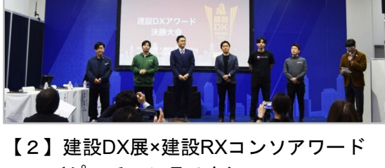
【2】建設DX展×建設RXコンソアワード ＜ピッチコンテスト＞