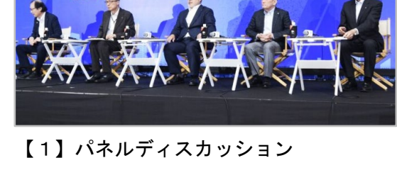
【1】パネルディスカッション

建設DX展で行われる2つのイベントに参画いたしました。 特別セミナーにも登壇し「今求められる建設DX技術」について、 現場での実装事例を交え、業界の課題解決に向けた議論を深める貴重な機会となりました。